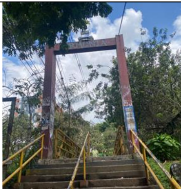
Foto No. 11- Pórtico de soporte de tirantes puente colgante.