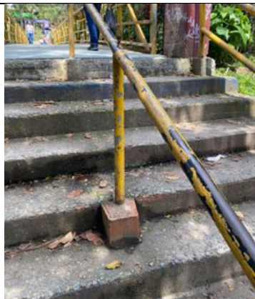
Foto No. 14- Pasamanos en escaleras del puente colgante.