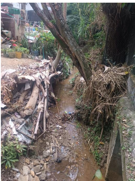
Foto No. 5- Quebrada el Ahogado