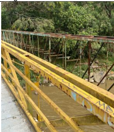
Foto No. 13- Pasamanos del puente colgante.