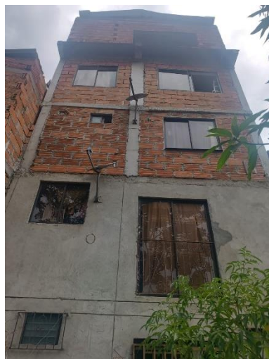
Foto No. 4- Vista de la parte posterior de la vivienda, donde se evidencia el quinto piso construido