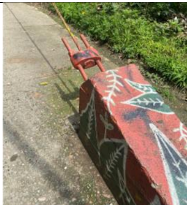
Foto No. 16- Contrapeso y anclaje de tirantes principales del puente colgante.