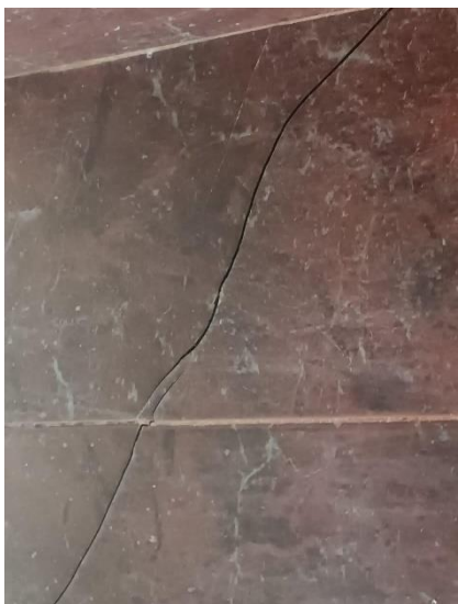
Foto No. 7- Enchape de la ducha fracturado por desplazamiento lateral de columna posterior de segundo piso.