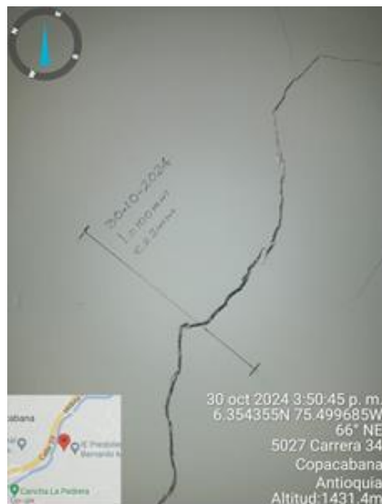
Foto No. 8- Agrietamiento de columna central y testigo para monitoreo en segundo piso.