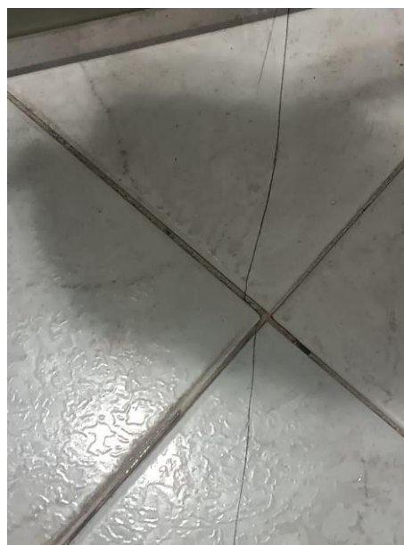
Foto No. 6- Piso fracturado en segundo piso del edificio