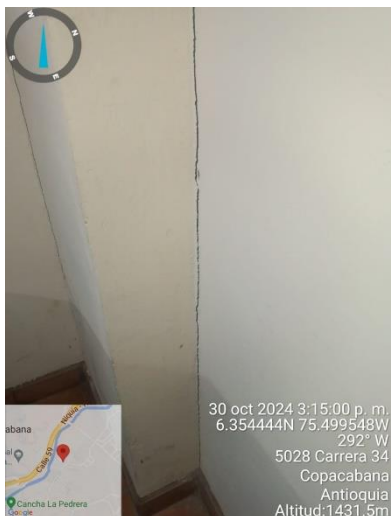
Foto No. 3- Vista de columna en primer piso separada del muro