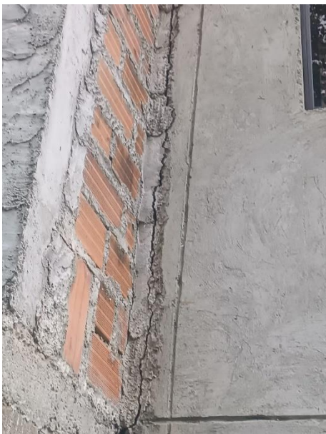
Foto No. 9- Grieta en columna en la parte posterior del edificio que alcanza aproximadamente 250mm en la parte alta