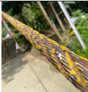
Foto No. 12- Cable principal del puente colgante.