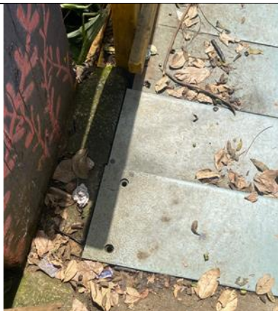
Foto No. 15- Piso en madera plástica del puente colgante.