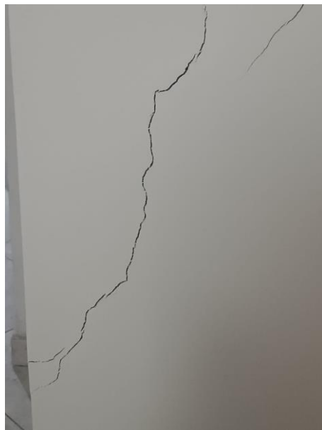
Foto No. 10- Agrietamiento de columna central en segundo piso.